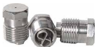
Dysze "AP2" NPT 1/8"